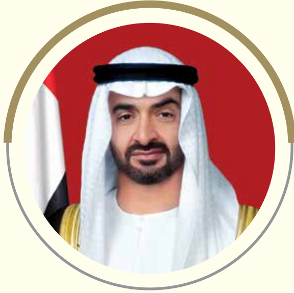
الفريق أول صاحب السمو الشيخ محمد بن زايد آل نهيان ولي عهد أبوظبي نائب القائد الأعلى للقوات المسلحة